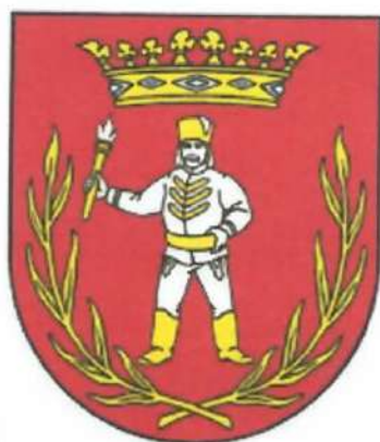
Erb obce :